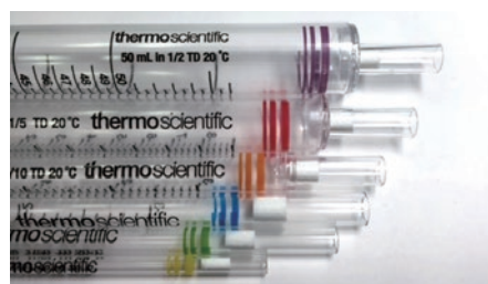
透明のアダプターと液体保持力の高いPET フィルター