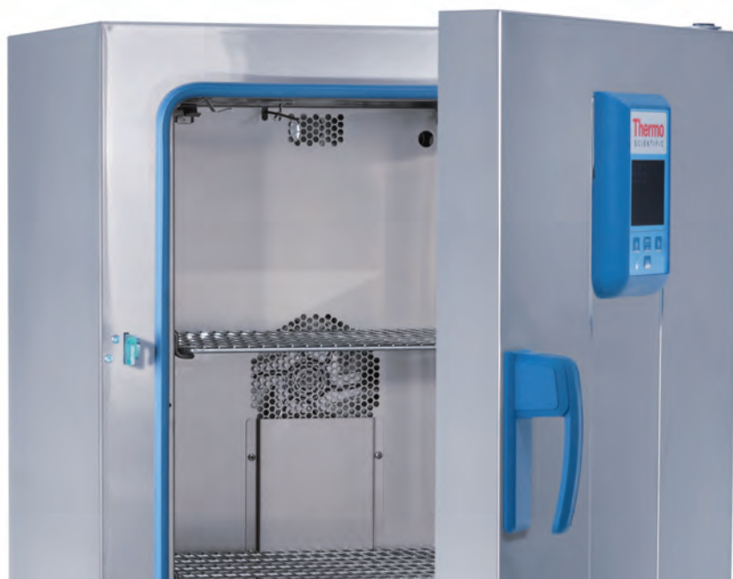
Modèle 100 L

Intégrant tous les avantages des étuves de paillasse General Protocol, la gamme Advanced Protocol est dotée de caractéristiques supplémentaires qui offrent davantage de souplesse, de précision et de fiabilité.