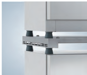
Kit de gerbage