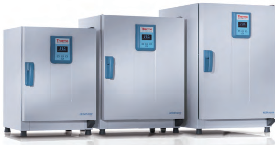
Modèles 60 L, 100 L, 180 L

Les étuves Heratherm ont une enceinte intérieure avec des coins arrondis faciles à nettoyer