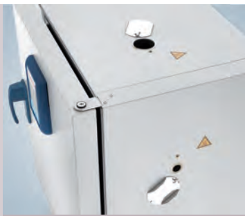
Port d'accès, face supérieure et côté droit

Contactez Thermo Fisher Scientific pour obtenir des renseignements sur nos solutions spéciales. Nous pouvons proposer les étuves de paillasse Heratherm pour des applications d'essai de câbles, des applications en salle blanche et des applications de gaz inerte avec enceinte intérieure étanche au gaz. Nous pouvons proposer des ports d'accès supplémentaires pour les étuves de grande capacité à l'emplacement souhaité, sur demande.