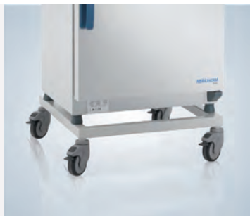
Piètement avec roulettes