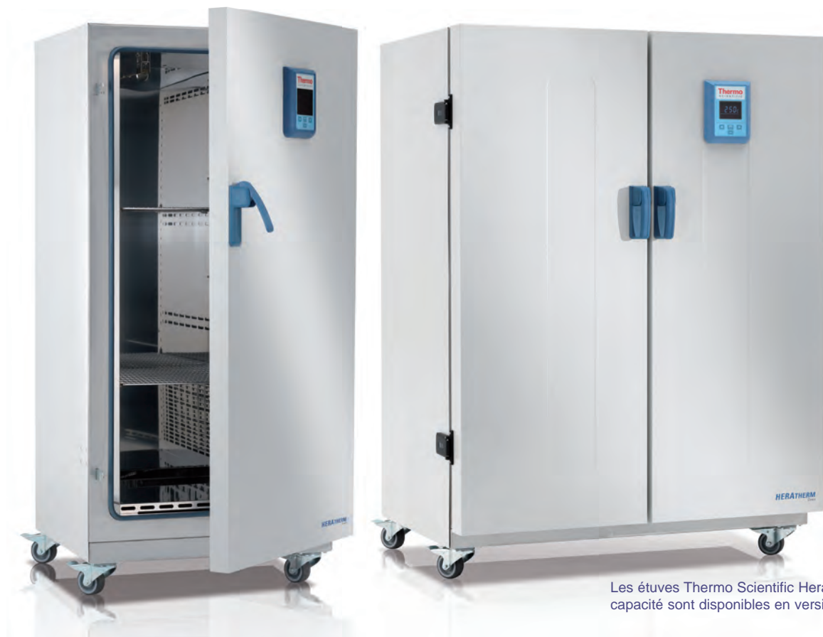
Les étuves Thermo Scientific Heratherm grande capacité sont disponibles en versions 400 L et 750 L

Les études Heratherm grande capacité ont été conçues pour répondre à votre besoin d'échantillons plus encombrants ou de volume d'échantillon élevé. Les étuves General Protocol offrent une grande capacité pour vos applications de séchage et de chauffage au quotidien.