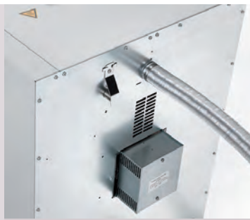
Kit d'installation sous paillasse