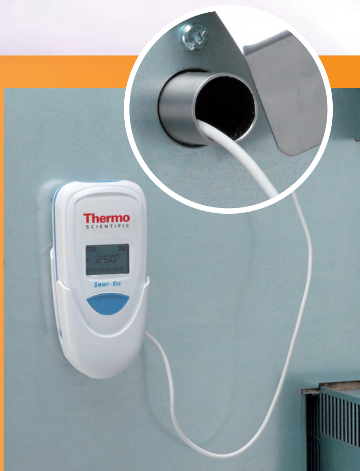
Vue arrière de l'étuve Advanced Protocol 100 L avec Smart-View

Les solutions varient selon les régions RF dans le monde entier et sont compatibles avec de nombreux types et marques d'équipements de laboratoire. Contactez votre représentant local pour de plus amples détails.