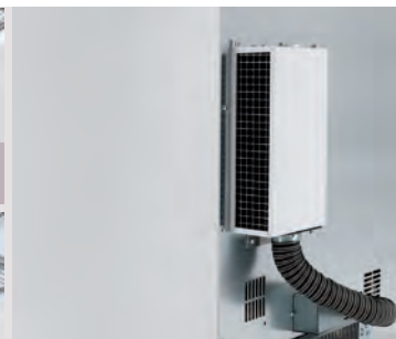
Filtre à particules