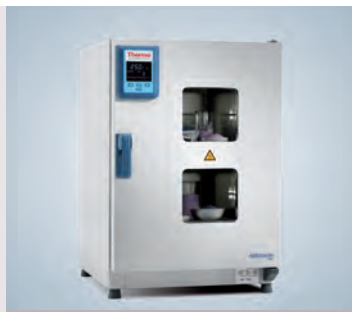
Fenêtre d'observation appareil de 180 L