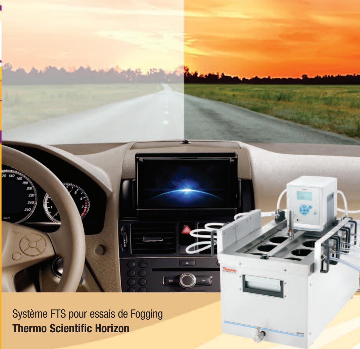
Système FTS pour essais de Fogging Thermo Scientific Horizon

Et les laboratoires d'essais privés et publics