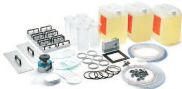
Accessoires Horizon FTS

© 2011 Thermo Fisher Scientific Inc. Tous droits réservés. Toutes les marques déposées sont des marques commerciales ou déposées de Thermo Fisher Scientific Inc et de ses filiales. Les caractéristiques, conditions et tarifs sont susceptibles d'être modifiés. Tous les produits ne sont pas disponibles dans tous les pays. Pour tout renseignement, veuillez vous adresser à votre distributeur local.