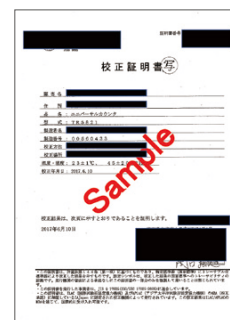
測定機器校正証明書