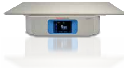
Solaris 4000 24x36