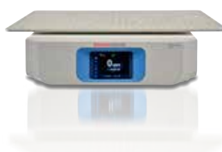
Solaris 4000 18x30