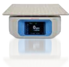
Solaris 2000 18x18