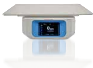
Solaris 2000 18x24