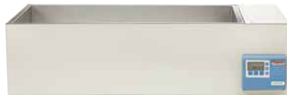
CIR 89 恒温水浴