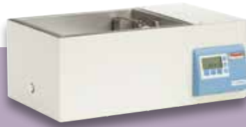
SWB 15 恒温水浴