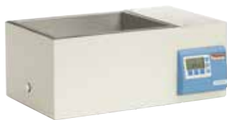
CIR 19 恒温水浴