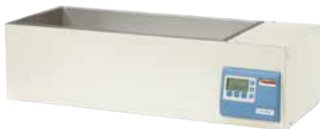
CIR 35 恒温水浴