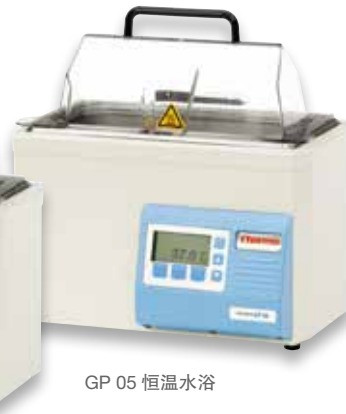
GP 05 恒温水浴