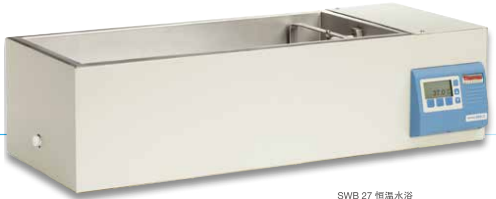
SWB 27 恒温水浴