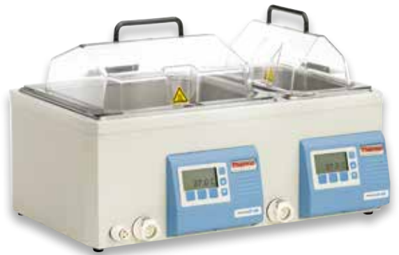
GP 15D 恒温水浴