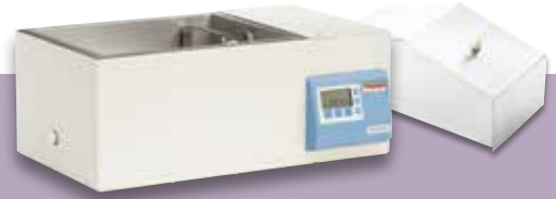
DUB 15 恒温水浴