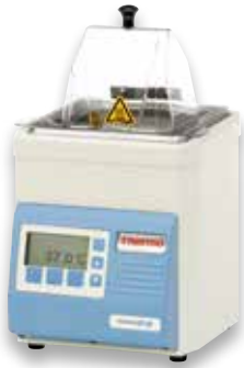
GP 02 恒温水浴