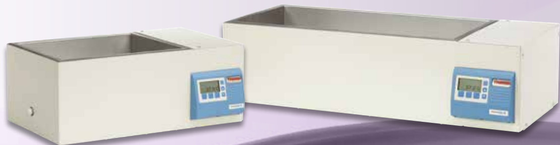
COL 19 恒温水浴