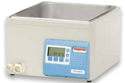
GP 10 恒温水浴