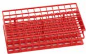
Nalgene Unwire 试管全固定架