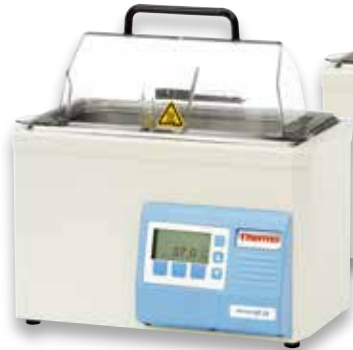
GP 2S 恒温水浴