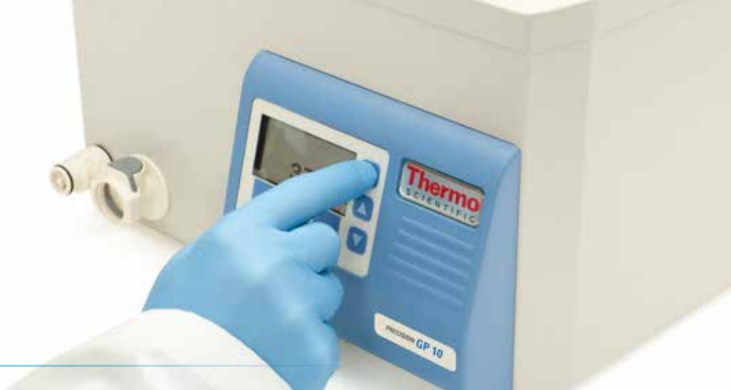
Thermo Scientific Precision 恒温水浴