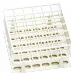
Nalgene Unwire 试管半固定架