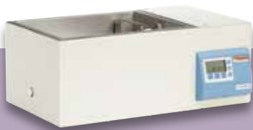
SWB 15S 恒温水浴