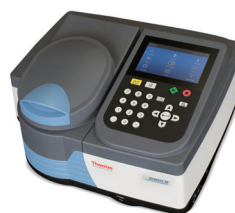
GENESYS 30 可視分光光度計