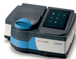
GENESYS 40 可視分光光度計